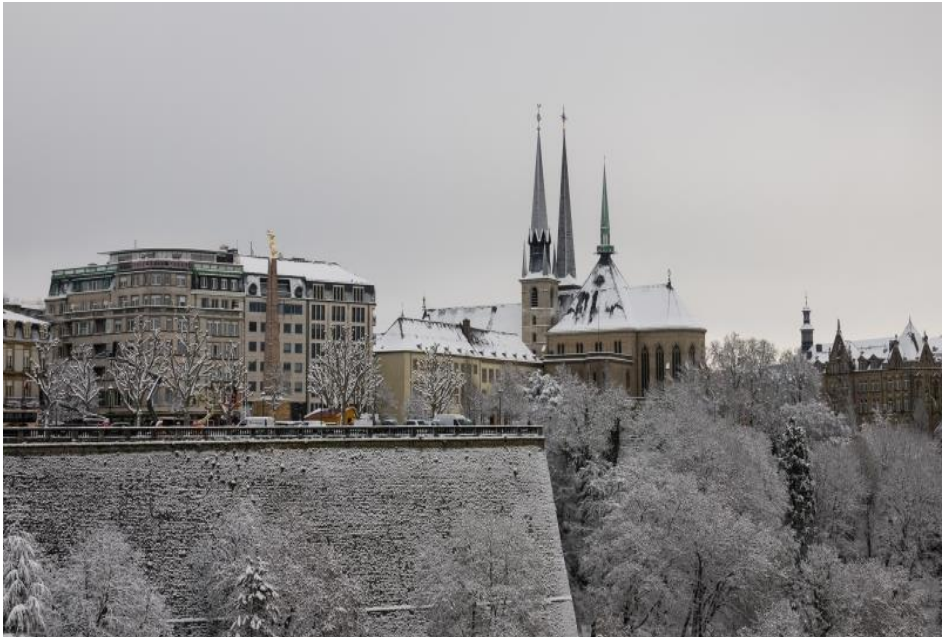
Kathedral vu Lëtzebuerg am Wanter