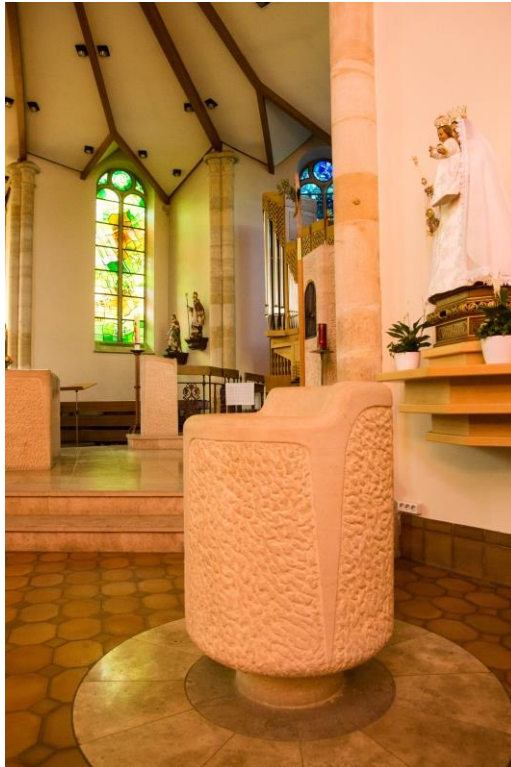
Dafsteen an der Nikloskierch zu Habscht.

Uschléissend: eucharistesch Ubiedung (bis 10:00 Auer).