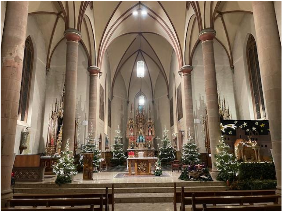
D'Biisser Kierch an der Chr schtz it d'lescht Joer

Abb  Jo l Santer, Paschtouer & Abb  Jos Halsdorf, Diakon