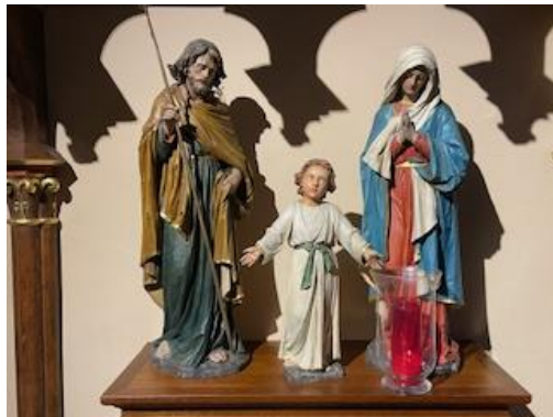
Statuen vun der Helleger Famill an der Parkierch zu Bruch