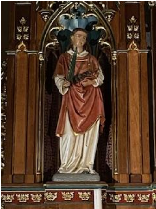
Statue vum hellege Stephanus um Héichaltoer an der Kierch zu Biissen

Kollekt fir de Finanzement vun eise Kierchen an eiser Par!