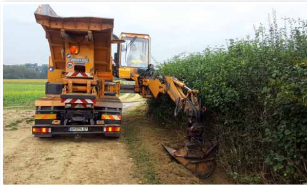
Curage de fossés