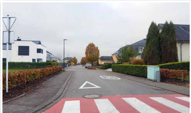
Remplacement des luminaires «um Wandhaff» par des LED