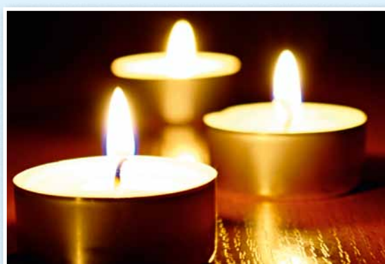
8 habitants de notre commune sont décédés.