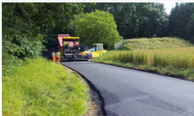
Réfection des voiries vicinales «Sengels», «Laangefeld» et «auf Roebben»