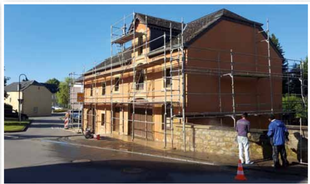
Rénovation façade et toiture du Veräinsbau