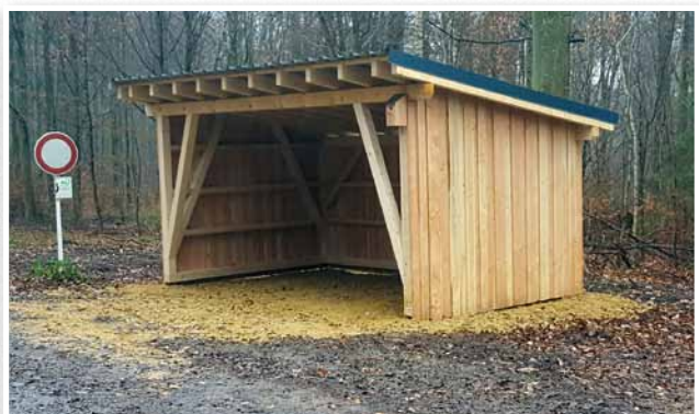
Mise en place des abris à «Haeleschter» et «Sengels»