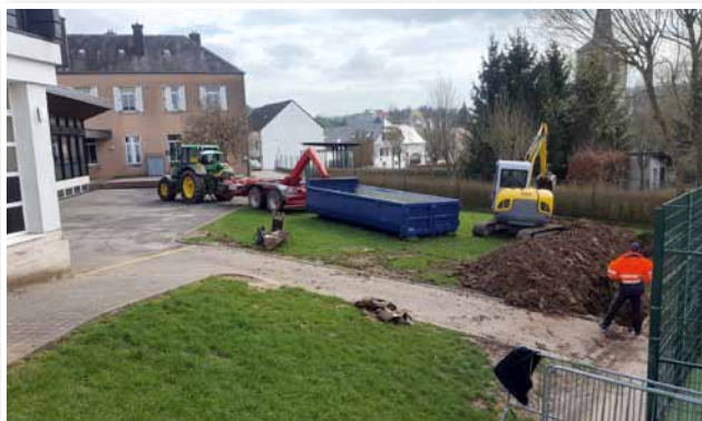
Travaux de drainage autour du Ministade