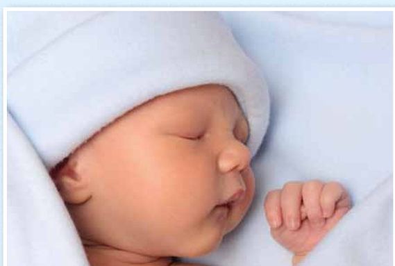
La commune a compté 25 naissances en 2016