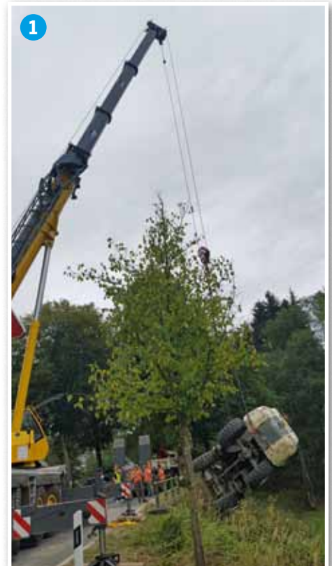
Asaz zu Bour. Ee Bagger war hei an engem Rampli ëmgetippt.