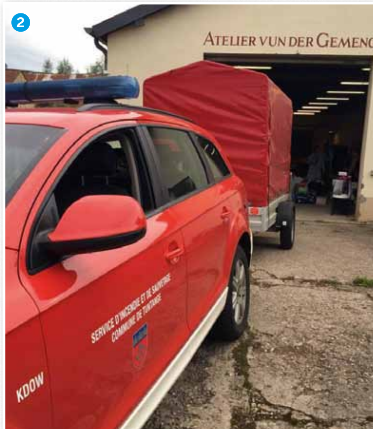
D'Saachen déi gespent gi sinn, goufen op Waldbëlleg bruecht, wou eng Sammelstell agerücht gi war.