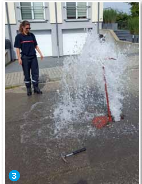
An wann ee net oppasst kann ee mol geduscht ginn. Mir hunn eis dann och un enger Aktioun zu Sandweiler bedeelegt, wou ronn 2000 Sandsäck gefëllt goufen. An Gitterboxe gelagert hu mir elo ronn 200 gefëllte Sandsäck am Stock, déi am Noutfall grëffbereet sinn.