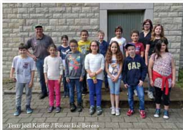
Text: Joël Kieffer

A la fin de cette petite excursion didactique, les élèves ont eu le plaisir de manger un bon «Thüringer», accompagné d'un grand cru «Maandelbaach»!