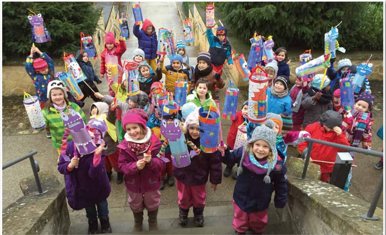
Liichtmëssdag op der Gemeng