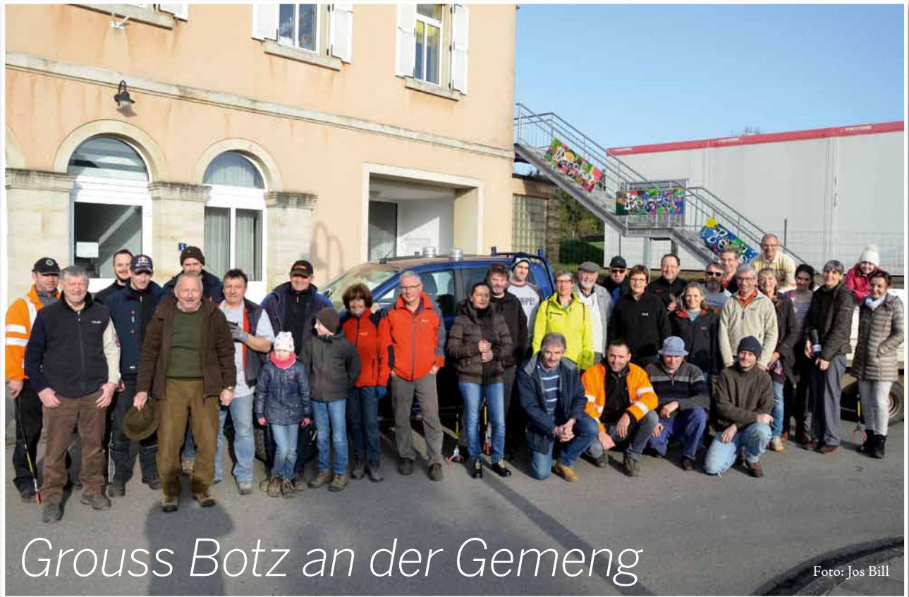
Grouss Botz an der Gemeng