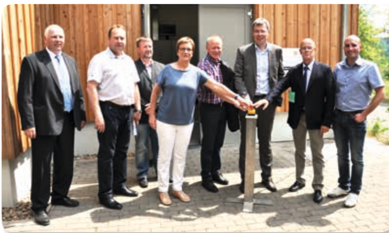
Inauguration station de pompage Léisbech

Environ 19 millions (TTC et honoraires inclus) seront investis en tout dans l'assainissement de la vallée de l'Eisch, subventionnés à raison de 90% par l'Etat à travers le Fonds pour la gestion de l'eau.