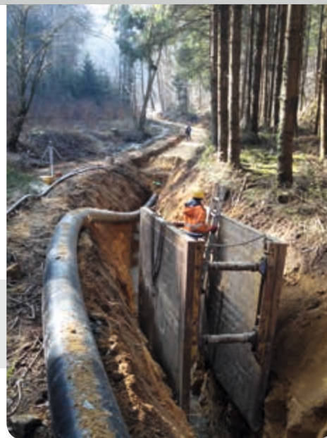
Chantier collecteur Léisbech