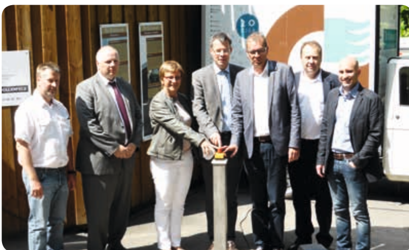
Inauguration STEP Hollenfels