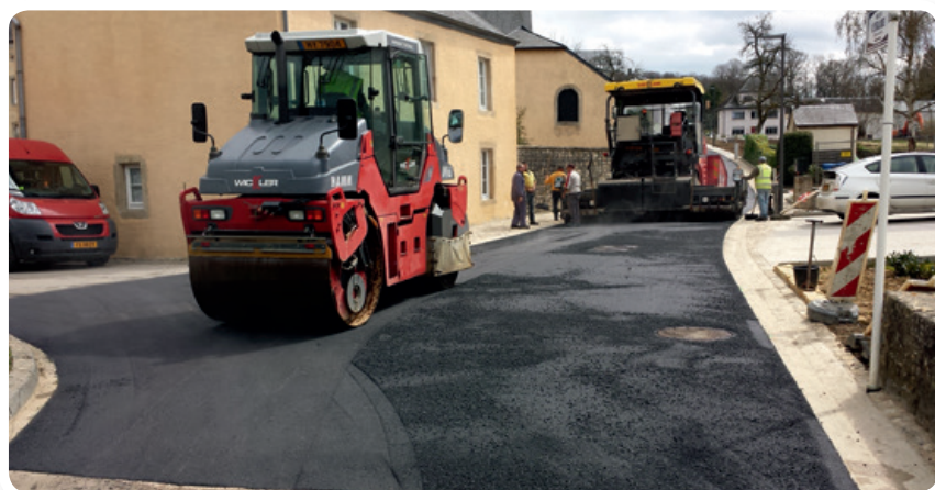
Nouvelle couche de roulement / Einbringen der neuen Fahrbahn