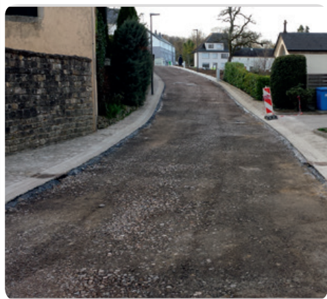
Reprofilage de la route (pavés, bordures, caniveaux) Neugestaltung der Straße (Pflastersteine, Bordsteine, Regenrinnen)