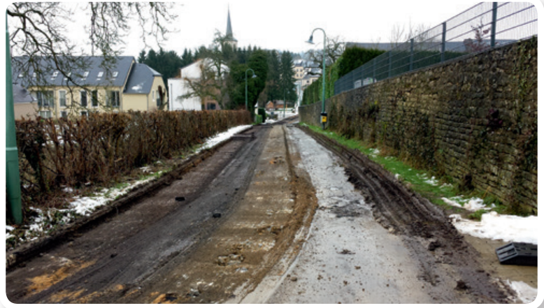
Fraisage de la chaussée / Abtragen der alten Straße

Infrastrukturarbeiten (Abwasser, Versorgungsnetze, LED-Straßenbeleuchtung)