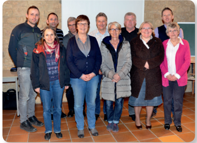
Generalversammlung vum der a.s.b.l. „Schoulkanner aus der Gemeng Téinten“ den 2. Mäerz 2015