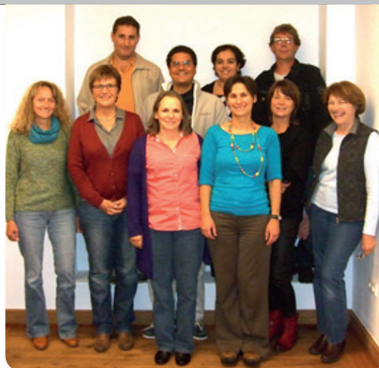
Texte: Commission d'intégration