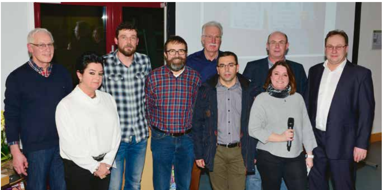
DËSCH-TENNIS BËSCHDREF, Montée vun der 3. an déi 2. Divisioun am Dësch-Tennis Championnat 2015-2016