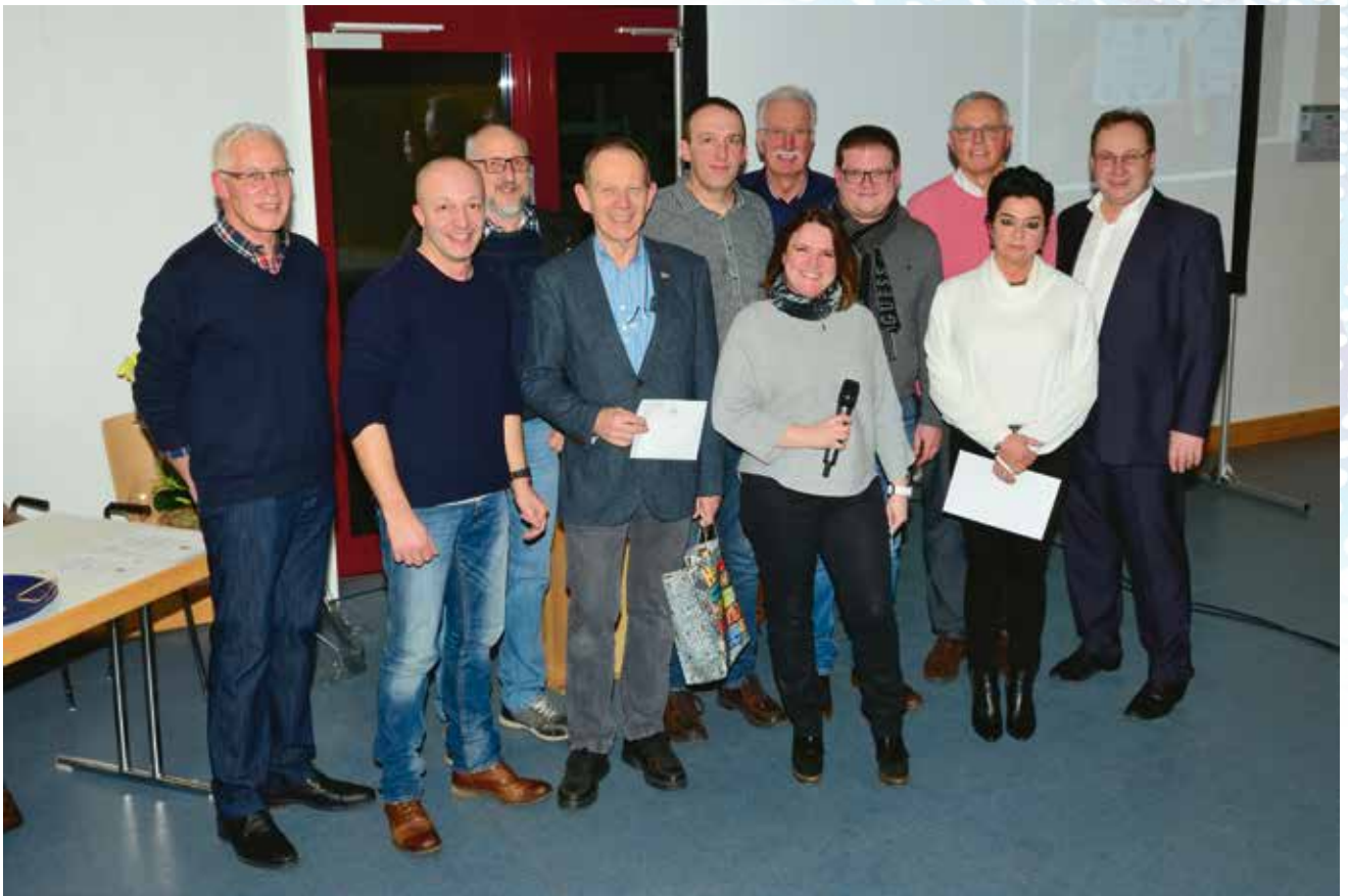
SCHÉISSCLUB BRUCH, Montée vun der 2. an déi 1. Divisioun am Schéissport Championnat 2015-2016 (1. Plaz an der Disziplin cal-fac)