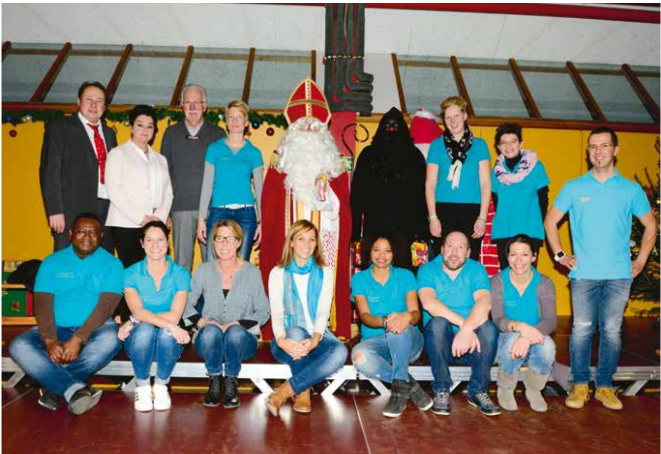
d'Organisationsaarbecht louch bei der Elterevereenegung.