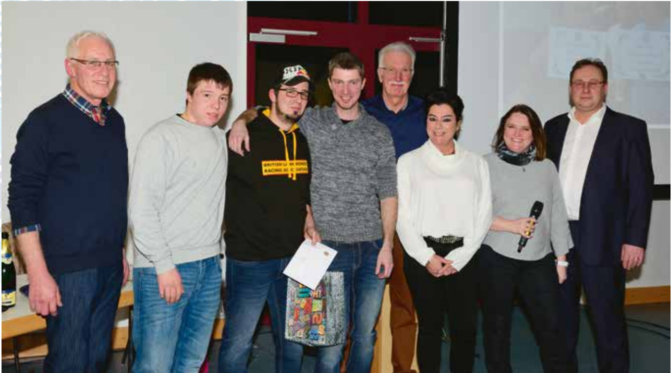
GRASHOPPERS ATERTDALL, 2. Plaz am 12 Stonne Rasi-Cross Rennen an England