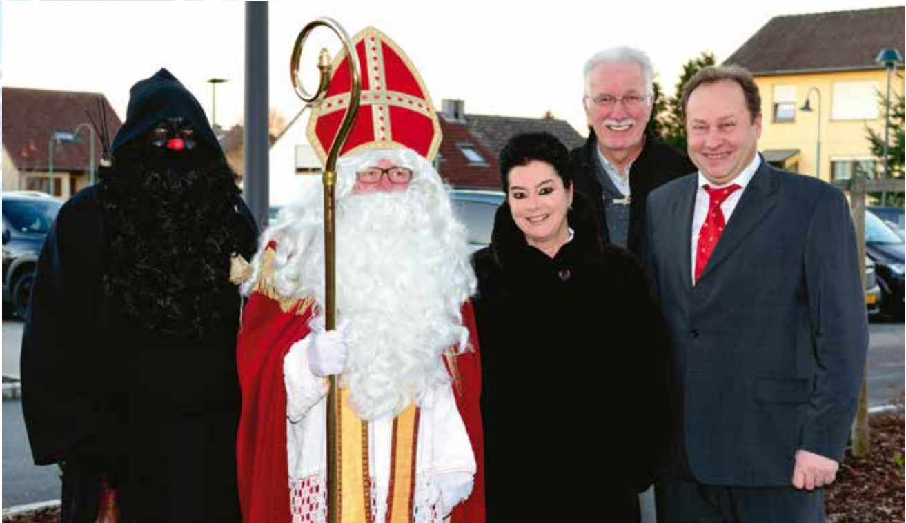
Den hellegen Duo ass „am Lëttschert“ vum Schäfferot empfaang ginn ....

Wéi all Joer huet de léiwe Kleeschen déi brav Kanner aus der Gemeng nit vergeess. Wëll et jo e „Gudde Mann“ ass, huet en heiansdo en A zougedréckt an duerfir jidder Kand eng schéin Tiitchen ginn, säin Houseker war och domat d'accord!