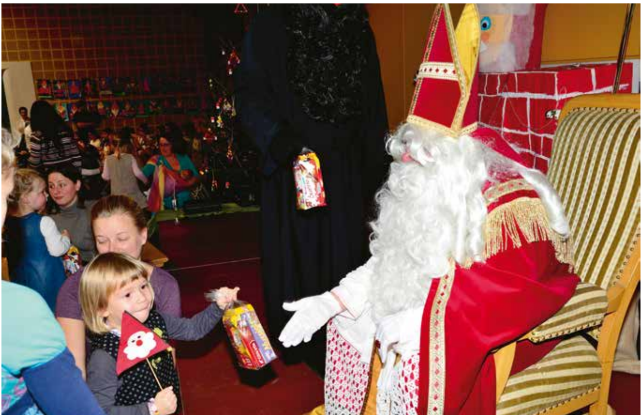
a war dunn häerzlech wëllkomm an enger flotter Feierstonn, déi d'Kanner mat hirem Léierpersonal an der Fanfare Gemeng Béiwen dem Kleesche mat sengem Houseker am „Centre Lëttschert“ offréiert hunn.