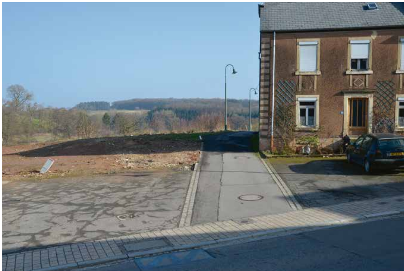
Der Gemeindeweg „an der Uecht“ in Boewingen/Attert wird verbreitert und mit einer komplett neuen Infrastruktur ausgestattet.

Schöffe Mathekowitsch berichtete über ein positives Austauschgespräch mit der Gemeinde Bissen zur Anlage über die frühere Eisenbahnlinie eines Fahrradweges von Boewingen/A. nach Bissen. Man warte jetzt noch auf die Stellungnahme des Umweltministeriums, bevor man über den Ankauf des benötigten Geländes mit den Eigentümern in Verhandlung trete.