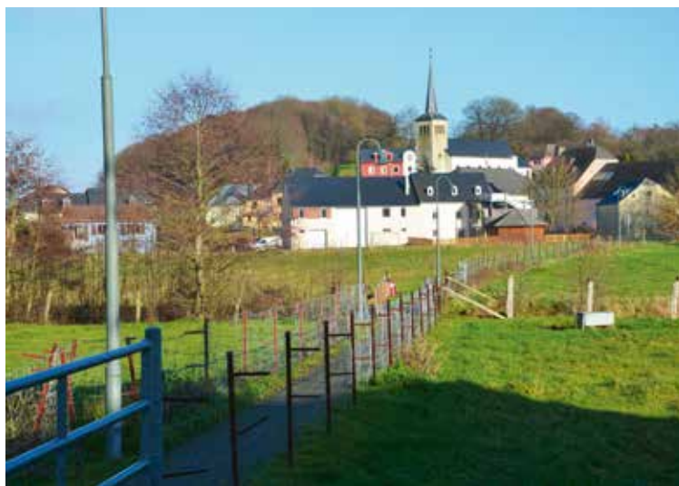
Site du parc projeté à Buschdorf

Le conseil communal approuve à l'unanimité le projet voulu.